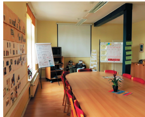
Autismus-Ambulanz Rostock: Seminarraum

Auf entsprechenden Wunsch führen wir diesen Workshop auch für Teams und Institutionen durch. Bei Interesse und Terminanfragen wenden Sie sich bitte direkt an uns.